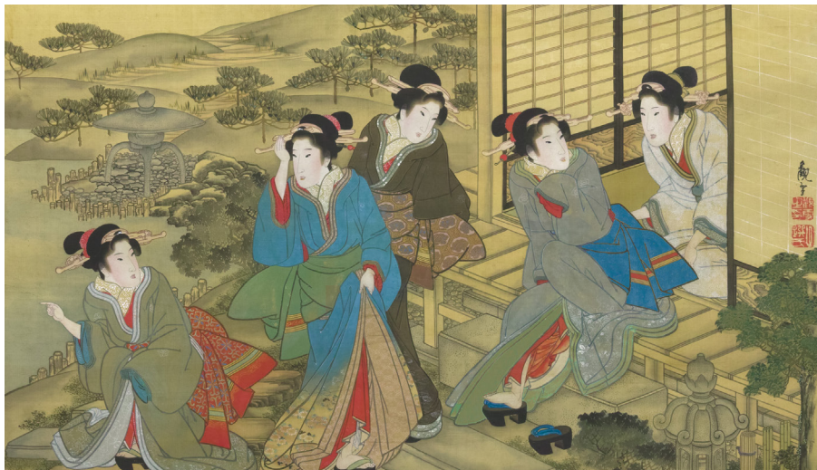
Image credit: Kansetsusai Tsukimaro Five Beauties circa 1825. Private collection.

オークランドアートギャラリー トイ オ タマキは、2020年3月7日土曜日より、日本の江戸時代（1603年～1868年）の稀有で並外れた芸術作品をご紹介します前例のない展示会を開催します。