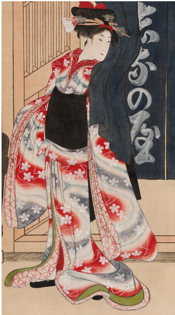
Utagawa Toyokuni Iwai Hanshiro V (detail) circa 1810, hanging scroll, ink and colour on paper. Private collection.